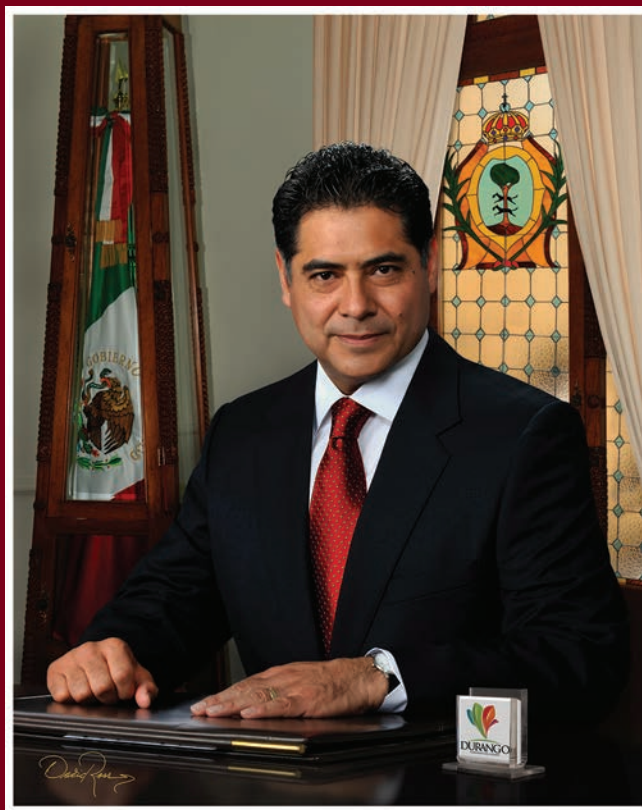
C.P. Jorge Herrera Caldera Gobernador Constitucional del Estado de Durango